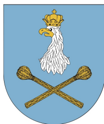
Honorowy Patronat Burmistrza Sulejówka