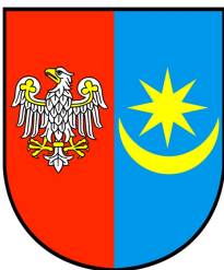
Honorowy Patronat Starosty Mińskiego