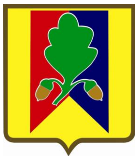
HONOROWY PATRONAT WÓJTA GMINY DĘBE WIELKIE