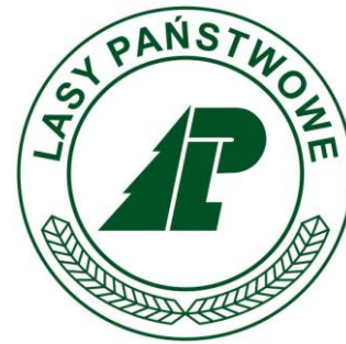
NADLEŚNICTWO MIŃSK NADLEŚNICTWO CELESTYNÓW