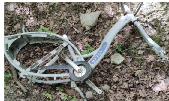
Obiekt w PK